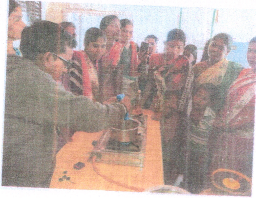
News Published (If any)